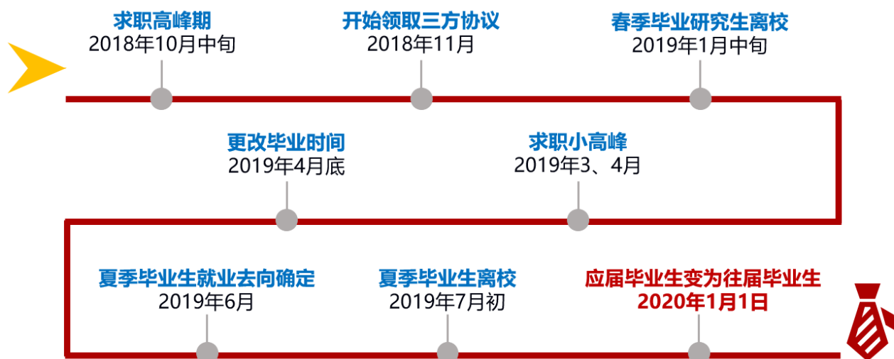
图一：毕业生就业关键时间点

随着毕业的临近，从 11 月份起，工学院学工办将开始为同学们办理就业相关的手续。现对相关就业政策及手续办理进行说明，请同学们仔细阅读。